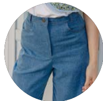
Sewing pattern „The Dina Jeans“