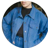
Sewing pattern „The Jean Jacket“