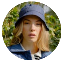
Sewing pattern The Bucket Hat