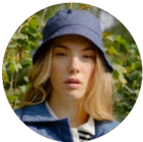
Schnittmuster The Bucket Hat