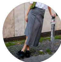
Asymmetrischer Rock „The Willow Skirt“